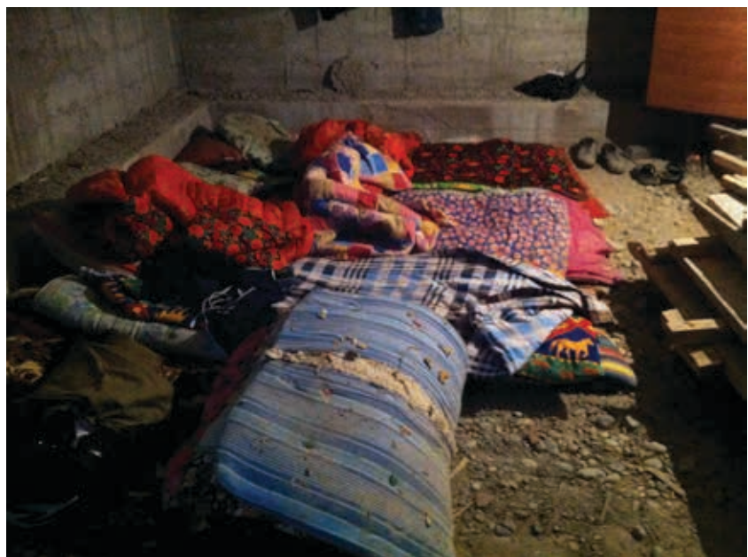
Кровати трудящихся-мигрантов на строительной площадке в Шымкенте, ноябрь 2017.

«Мы жили в бытовках на огражденной от внешнего мира колючей проволокой и забором строительной площадке, за которую нельзя было выходить. Это была стройка коттеджного поселка. Бытовки были крайне маленькими. В них умещалось всего 4 двухъярусных кровати, между которыми оставался узкий проход. Работали с 8 утра до 20 вечера все месяцы, кроме летних. Когда было сильно жарко, нам разрешали отдыхать, но тогда работали до 22 часов. Выходных не было, но можно было по желанию отпрашиваться. В таком случае тебе не платили ничего. Никаких норм не было. Как правило, характер работ менялся, как только предыдущее задание было выполнено. В месяц зарплата составляла 22-23 тысячи сомов вместо 25, которые обещали, так как оказалось, что хозяин вычитает деньги за питание. Рабочие пробовали возмущаться, но это ни к чему не приводило. Ни у кого не было договоров и нормально оформленных документов.» 82