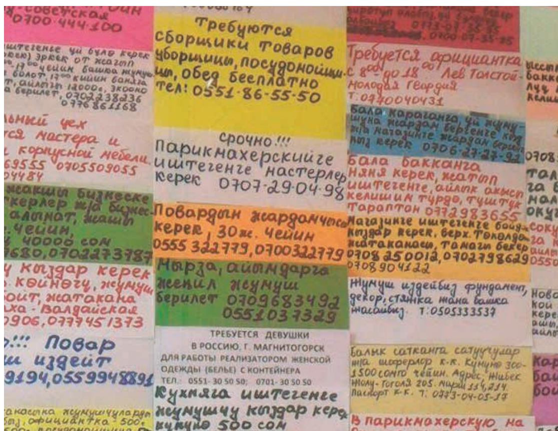
Объявления о работе на рынке в Бишкеке, Кыргызстан. Ноябрь 2017.

В то время как подростки из Кыргызстана, преимущественно мальчики, трудятся на многочисленных рынках Казахстана грузчиками, сторожами «контейнеров» или продавцами товаров 200 , в последние годы все больше девочек 12-17 лет родители отправляют работать нянями к соотечественникам, переехавшим в Казахстан и Россию.