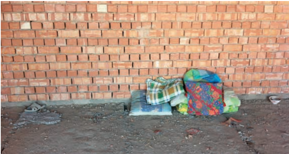
Подушки для отдыха трудящихся-мигрантов на строительной площадке в Шымкенте, ноябрь 2017.

«Из Кыргызстана нас вывозили нелегально, в объезд границы. Мы узнали об этом уже когда прибыли на место работы. Там были адские условия. Нас разместили в юрте, а не в нормальных домах, как обещали. Внутри было сыро и холодно. За пределы стройплощадки нас практически никогда не выпускали. Только иногда мы сбегали на рынок. Каждый раз, когда мы выходили, нас задерживала полиция за то, что у нас не было регистрации. Мы постоянно откупались. Все это было в октябре-ноябре, и погода была дождливая. Я работал каменщиком, объект находился в низине, поэтому мне часто приходилось работать по колено в воде по 8-10 часов. Через пару недель я заболел и слёг на месяц. Видимо, из-за того, что я работал под дождем и одежда всегда была влажной. У меня отекло лицо, была сильная температура и лихорадка. Я не знаю, какой был диагноз. В поликлинику меня не отпускали. Врачей не вызывали. Медикаментов тоже не давали. Только поили чаем и какими-то травами.» 83