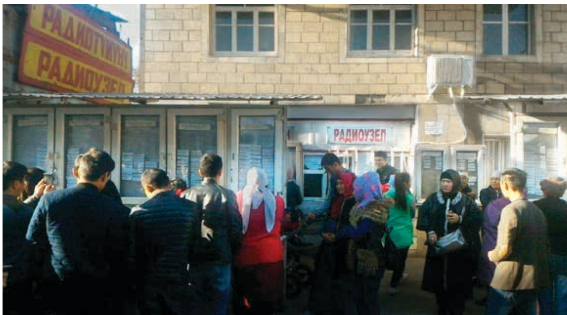
Радиоцентр объявляет о вакансиях на рынке в Оше, Кыргызстан. Ноябрь 2017.

Кыргызстанские мигранты с неурегулированным статусом вынуждены работать без письменного договора с работодателем или по фиктивным договорам, которые не защищают их прав. Они часто становятся жертвами нелегальных и коррумпированных посредников, которые при трудоустройстве отбирают у них деньги и документы. Это неофициальное трудоустройство может начаться и в Кыргызстане – с объявлений в газетах, устных предложений на рынках, или через «знакомых».