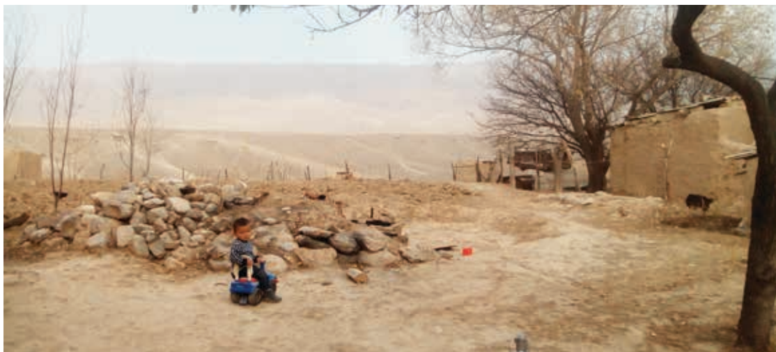
Члены семьи этого мальчика стали жертвами торговли людьми. Его мать содержалась в рабстве. Кыргызстан, ноябрь 2017.

значительно осложняет их работу. 173 Институт УПЧ в Кыргызстане не предусматривает отдельной должности уполномоченного по правам ребенка, но в центральном аппарате есть отдел, занимающийся правами несовершеннолетних. Тем не менее, обращения в региональных офисах УПЧ по нарушению прав детей в Кыргызстане встречаются редко и, как правило, связаны с отъездом родителей в миграцию и неспособностью родственников содержать детей и выполнять надлежащие обязанности. 174