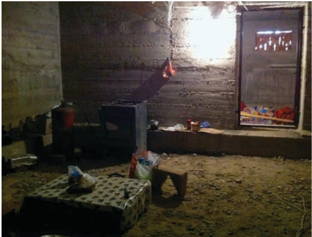
Кухня трудящихся-мигрантов в подвале на строительной площадке в Шымкенте, ноябрь 2017.

Характерные случаи этих нарушений были описаны жителями Ошской и Баткенской областей, работавших в Казахстане: