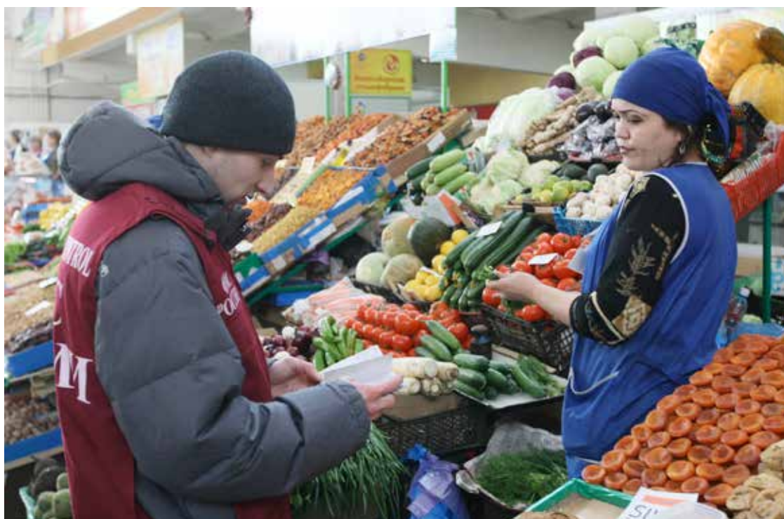
Федеральная миграционная служба проводит проверки на рынке в Новосибирске. 2 февраля 2011 г.

Кыргызские власти должны принимать все необходимые меры для обеспечения защиты прав кыргызских мигрантов и членов их семей за рубежом, а также для обеспечения защиты прав членов семей мигрантов, оставшихся в стране, и тех, чья уязвимость усугубляется социальными последствиями миграционного процесса в Кыргызстане. Российская Федерация и Казахстан должны также сделать все возможное для защиты прав кыргызских мигрантов на своей территории. FIDH выработала ряд рекомендаций, которые находятся в конце доклада.