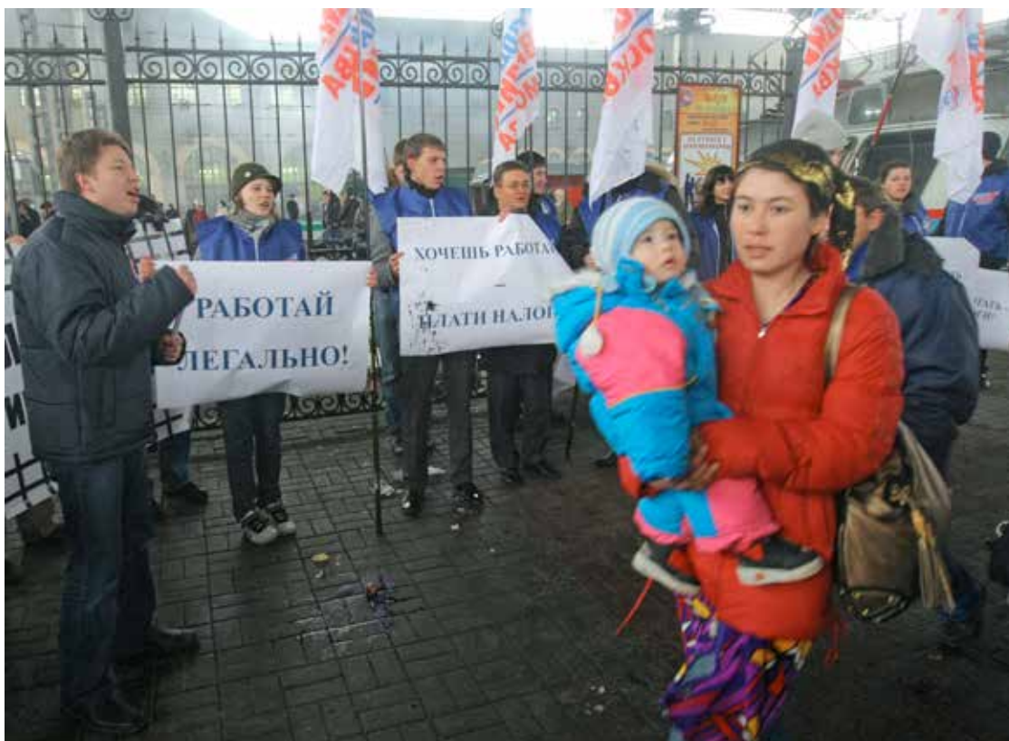
Российская Федерация, Москва. Члены Молодой гвардии «Единой России» оскорбляют трудящихся-мигрантов во время митинга на Казанском вокзале. 2009 г

В связи с отсутствием информации о сексуальном здоровье и под влиянием консервативных «традиционных ценностей» общества, которые препятствуют любым разговорам на эту тему, молодые мигранты, проживающие за рубежом, ничего не знают о безопасном сексе. По результатам проведенного в 2015 г. исследования Красного Креста 169 , 20% от числа опрошенных кыргызстанских мигрантов, имевших несколько половых партнеров, не предохранялись при половых контактах. 82% опрошенных мигрантов (из Таджикистана, Кыргызстана и Узбекистана) не знали, где в России можно анонимно сдать тест на ВИЧ. Следовательно, большинство ВИЧ-инфицированных мигрантов по возвращении домой могут являться распространителями болезни – либо потому, что они не знают о ней, либо из страха огласки, в результате которой они могут подвергнуться остракизму. Таким образом, их жены, не имеющие доступа к информации о заболеваниях, передающихся половым путем, могут также быть инфицированы.