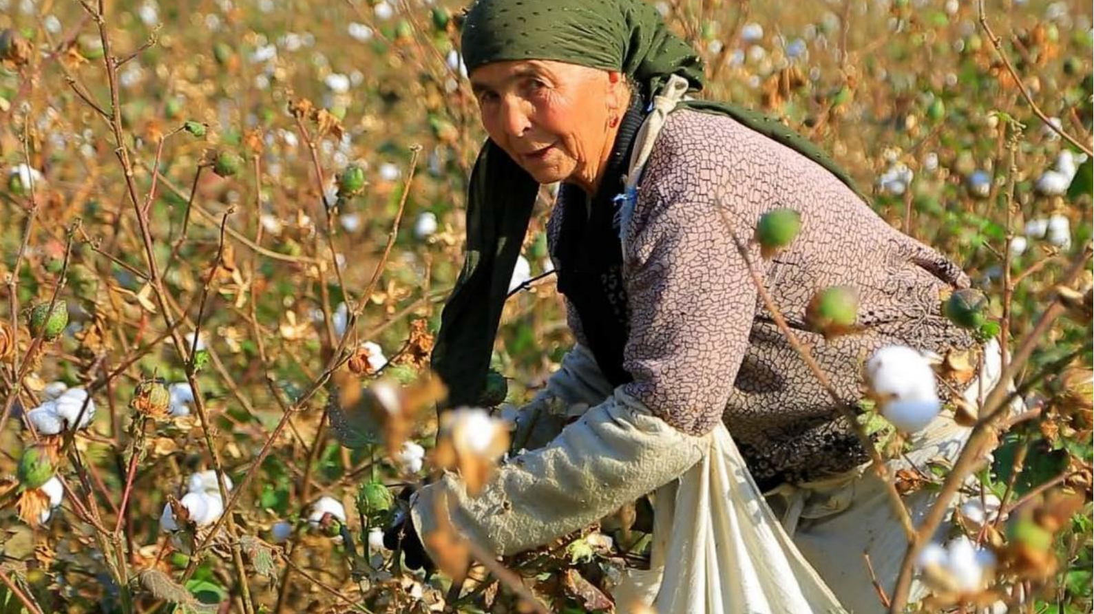
Сборщица хлопка, Андижанская область, октябрь 2023.