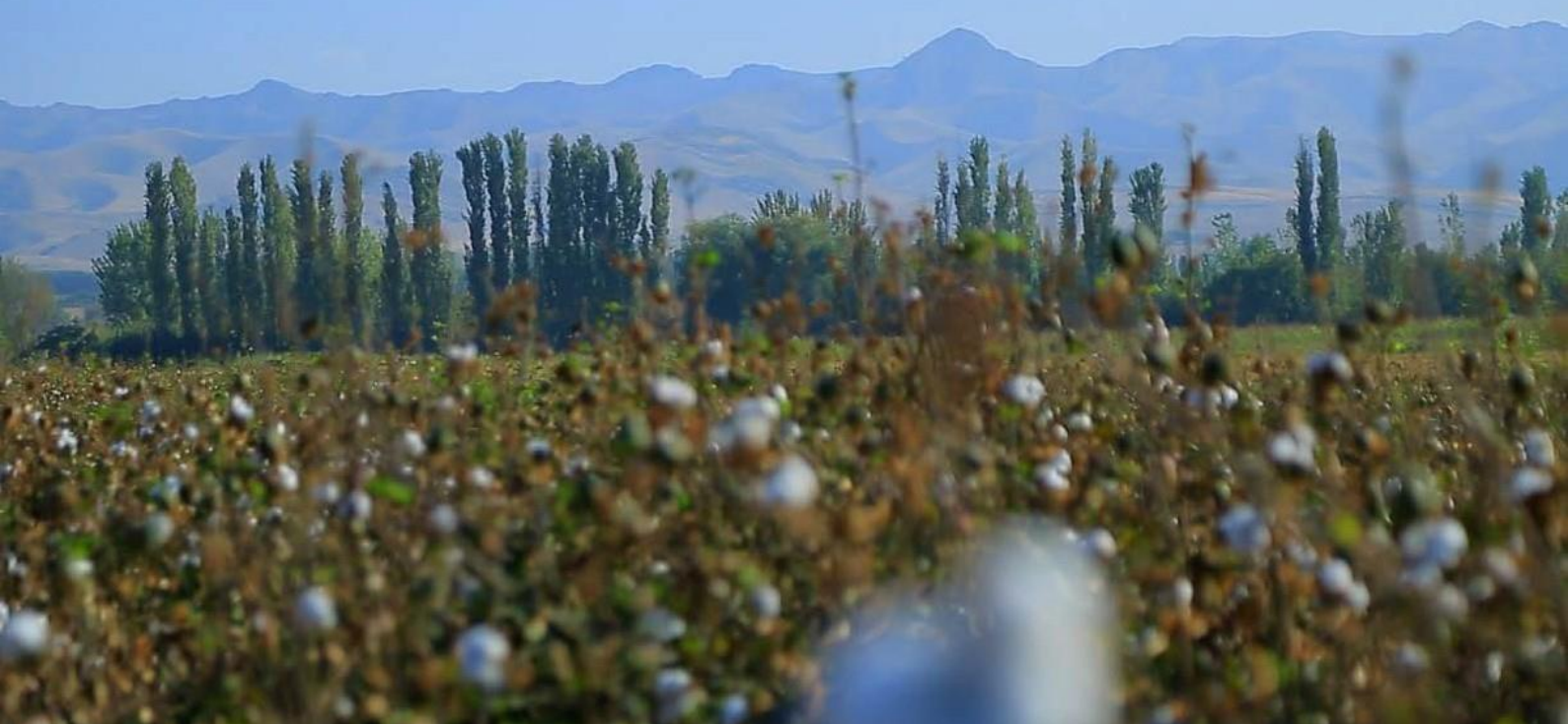
Cotton fields in Andijan, September 2023.

Ситуация в 2023 году оказалась далека от того, что обещал Воитов. В итоге закупочная цена была в одностороннем порядке установлена кластерами, скорее всего, по согласованию с хокимиятами и Министерством сельского хозяйства, которое отвечает за заключение контрактов между фермерами и кластерами. Фермеры получили от кластеров письма, где им объявлялась цена, не подлежащая обсуждению, в диапазоне от 6000 до 8500 сумов за килограмм хлопка.