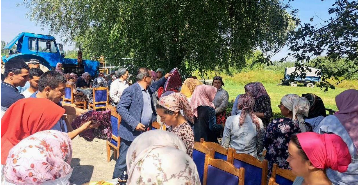
Бекзоджон Ибрагимов, хоким Бувайдинского района Ферганской области, раздает подарки соорщикам хлопка; 8 сентября 2023 г.