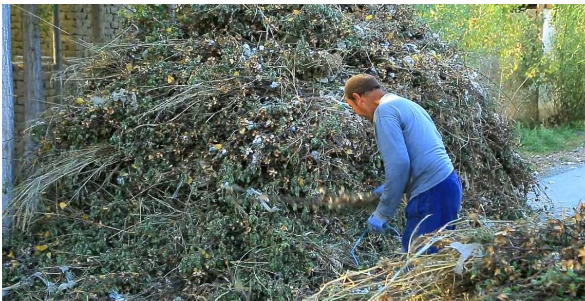
A farm worker transports cotton branches for heating in households. Andijan region, November 2023.

В середине сентября в интернет утекла и набрала большое число просмотров видеозапись 8 Zoom-конференции, которую проводил Шухрат Ганиев. В ходе совещания советник президента отчитал хокимов отстающих областей за низкие темпы уборки и нехватку сборщиков. Ганиев упомянул, что несколько областей не смогли мобилизовать десятки тысяч сборщиков и значительно отставали от графика сбора урожая. В частности, он отметил, что «из необходимых 220 тысяч сборщиков в Кашкадарье вышли только 140 тысяч, а в Бухаре из требуемых 160 тысяч – только 100 тысяч». В ходе совещания Ганиев угрожал главам регионов уголовным преследованием за неспособность организовать своевременный и успешный сбор урожая: «Фергана, по графику вы должны собрать 11500 тонн, а собрали только 8300. Бешарик, Багдад, Язаван, Риштан, Куштепа, Узбекистан – вызывайте хокимов в прокуратуру. Заводите дело на хокима Кувинского района...»