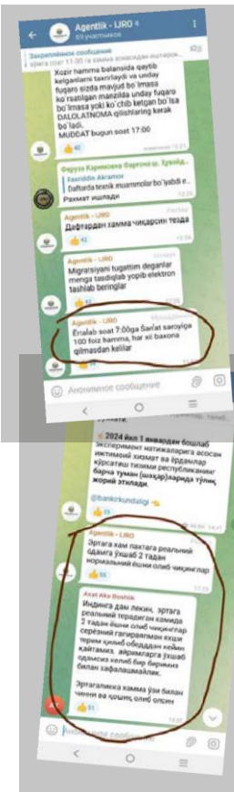
Сообщения Молодежного агентства Ферганы в адрес Радио Озодлик с описанием принудительной отправки на хлопок. Фото из соцсетей, 9 октября 2023 г.

Предположительно в ответ на поток сообщений в соцсетях о принуждении к сбору хлопка, Бобур Бекмуродов, руководитель квази-государственной НПО - национального движения «Юксалиш» и член парламента Узбекистана, опубликовал обращение с призывом покончить с принудительным сбором хлопка, заявив: «В эти дни предметом общественной дискуссии стали случаи незаконного привлечения людей к сбору хлопка. Эта практика должна быть полностью прекращена. Мы должны избавиться от старых подходов к управлению». 33