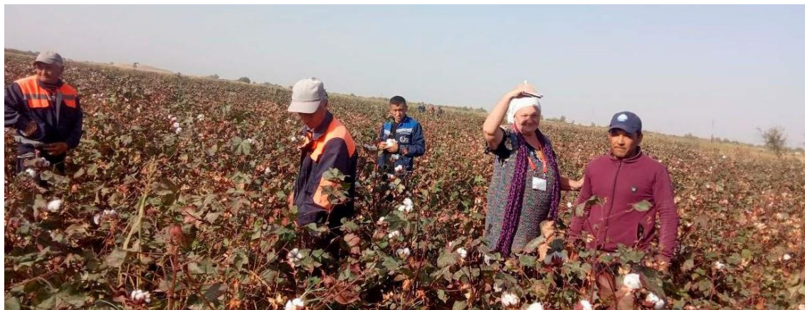
Сборщики в Нишане, Кашкадарья, 7 октября 2023.

Наблюдатели Узбекского форума провели интервью 19 с работниками Учкуприкской районной электросети Ферганской области. По словам одного из работников, «начальник сказал, что я должен идти собирать хлопок. Одних только женщин в селе недостаточно, чтобы собрать хлопок для фермера. Хлопок – это наше «богатство», и мы должны собрать его до наступления дождей и холодов, и если я откажусь, у меня будут проблемы с начальством. Он будет придираться к моей работе и может лишиться меня премии». В ответ на вопрос, наказывали ли его когда-либо раньше за отказ собирать хлопок, он ответил: «Нет, но я никогда раньше не отказывался. Если мне говорят собирать хлопок, я иду и собираю».